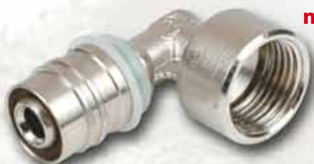
Kolano zaprasowywane nakrętne KISAN WL