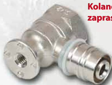
Kolano ustalone zaprasowywane KISAN WL