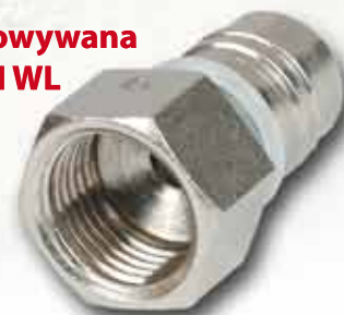
Złączka zaprasowywana nakrętna KISAN WL