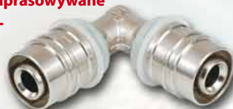
Kolano zaprasowywane KISAN WL