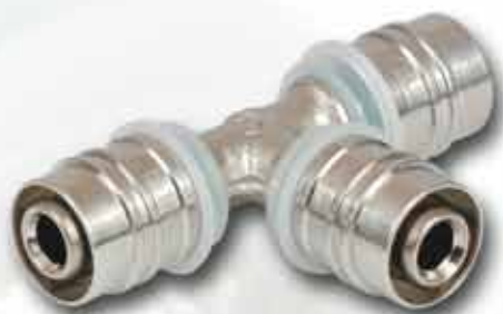
Trójnik zaprasowywany KISAN WL