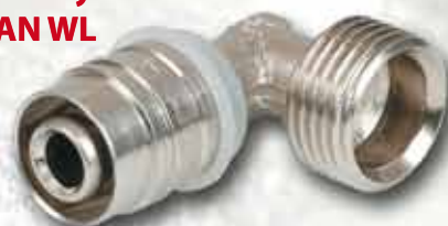
Kolano zaprasowywane wkrętne KISAN WL